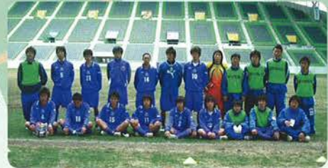
《準優勝 神戸国際附》