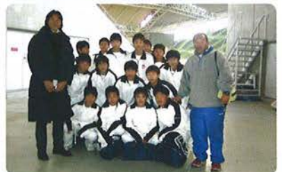
「選手と近いピッチレベルでボールボーイ体験できてヨカッタ!!」です。