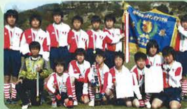
(男子) 優勝 神戸FC