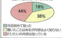
【励ます会を知っていますか。】