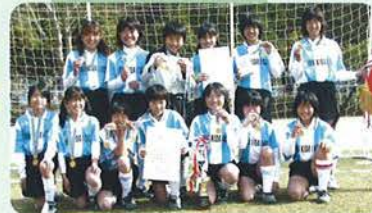
(女子) 優勝 つつじ井吹台