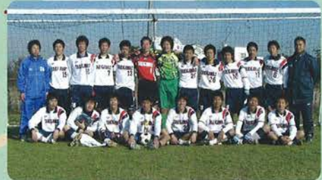
《優勝 滝川第二高校》

2月8日、兵庫県高等学校サッカー新人大会決勝が神戸ウイングスタジアム行われ、延長戦の末、滝川第二が神戸国際附を3-1で破り、2年連続12回目の優勝を決めた。