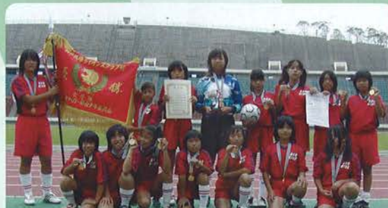
《4部優勝》フィオーレ