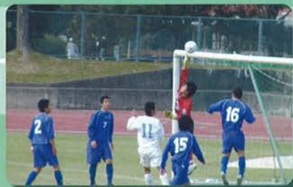
高円宮杯第16回全日本ユース(U-15)サッカー選手権大会

高円宮杯第16回全日本ユース(U-15)サッカー選手権大会は12月4日から宮城県石巻市総合運動公園ほか全国8会場で各地域予選を勝ち抜いた32チームで開催される。昨年まで16チームで行われていたが日本サッカー協会の3種(中学生)年代の活性化(CHQ:キャプテン・ヘッドクォーターズ推奨)によりチーム数の増加とリーグ戦が導入された。4チームの1次リーグののち上位2チームによる決勝トーナメントが行われ、12月25日国立競技場で決勝が行われる。