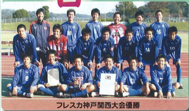
フレスカ神戸関西大会優勝

第17号 2005.1.1 (年4回発行) 発行所: 神戸市サッカー協会 〒651-0085 神戸市中央区八幡通2丁目1-10 三木記念神戸市立スポーツ会館内 TEL (078) 232-0753 FAX (078) 232-4647 発行人: 神戸市サッカー協会広報委員会 発行責任者: 榎原 徹夫 一部 100円