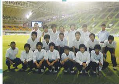
本日のボールボーイは 滝川高校サッカー部 2003のみなぎま

☆フラッグキッズは3団6名で参加。 「初めてフェアプレイフラッグをもってとても緊張したけどヨカッタです」「たくさんの観客の前で緊張しました。本番が終わって係りの人に『よかった!うまくできたネ!』と言われてとても嬉しかったです。」貴重な体験に子ども達の横後が輝いていましたね!いつかきっとプロサッカー選手として今度は同じピッチ内でゲームできることを目標にガンバレ!!