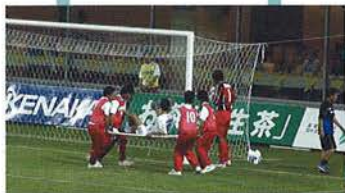
本日のボールボーイは 須磨友が丘高校サッカー部 2003のみなぎま