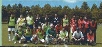
北五葉ウイング (兵庫県ママさんリーグチーム)