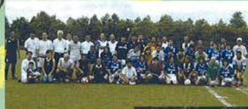
アジュール兵庫 (兵庫県ママ選抜)