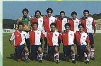
神戸フットボールクラブ1970シニアA