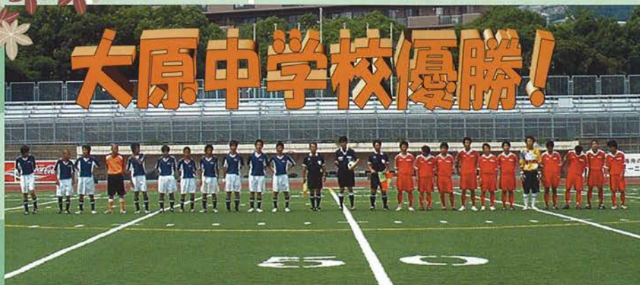
【神戸市総合体育大会神戸市立大原中学校優勝】

第12号 2003.10.1 (年4回発行) 発行所: 神戸市サッカー協会 〒651-0085 神戸市中央区八幡通2丁目1-10 三木記念神戸市立スポーツ会館内 TEL (078) 232-0753 FAX (078) 232-4647 発行人: 神戸市サッカー協会広報委員会 発行責任者: 榎原 徹夫 一部 100円