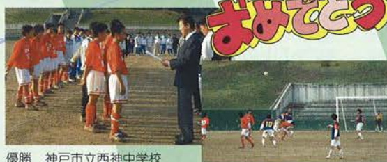
優勝 神戸市立西神中学校