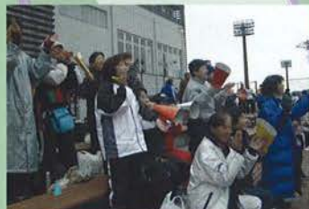
手製メガホンで応援する神戸FCママーズ