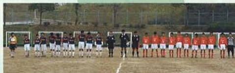
西神中学校・本庄中学校のメンバー

たくさんの方の応援があって優勝することができました。生徒たちも本当によく頑張ってくれました。県大会では神戸市代表として、良いゲームをしてきます。