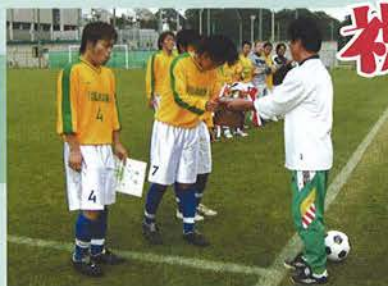
神戸市総体 優勝 つつじが丘