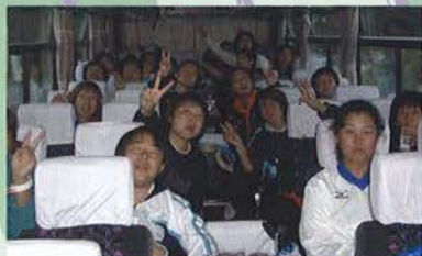
大型バス1台にアジュール兵庫の若手ママを前にバスの後部座席で陣取る45歳以上のベテラン(?)ママ軍団!和気あいの全国大会でした!