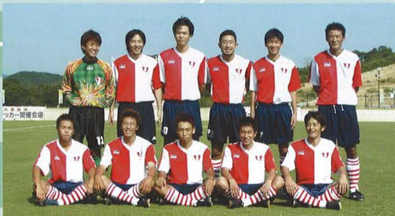
天皇杯代表決定戦出場の神戸FC