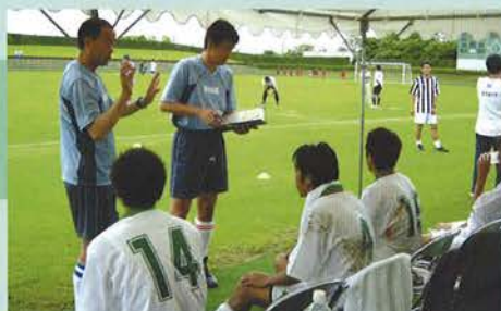
五大都市ハーフタイム